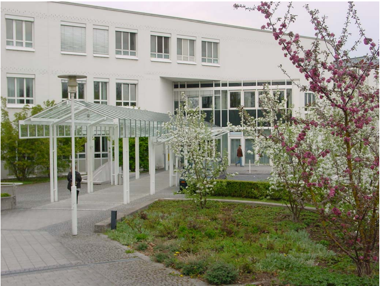
Abbildung: Haupteingang Klinikum Dritter Orden

Die menschliche Gesellschaft hat es schon immer als eine Verpflichtung betrachtet, in Not geratenen Menschen zu helfen. Bereits im Urchristentum sorgte man sich um die Armen und Kranken. So haben die Apostel Diakone als die beruflichen Diener der Armen- und Krankenfürsorge eingesetzt.