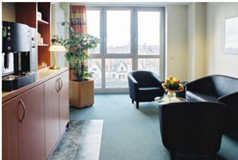
Aufenthaltsraum im St. Joseph Stift Bremen

Ein modernes Krankenhaus wie das St. Joseph Stift Bremen hat heute nicht mehr nur die Aufgabe, stationäre und ambulante Patienten zu behandeln. Vielmehr können wir den Patienten, Angehörigen und Mitarbeitern ebenso wie einem breiten Fachpublikum über unser Schulungszentrum und die innerbetriebliche Fortbildung Kurse zu den verschiedensten Themen anbieten.