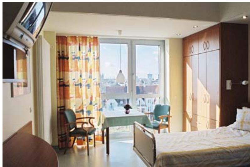
Patientenzimmer im St. Joseph Stift Bremen

Zeitbedingte Umgestaltungen werden bis zum heutigen Tage fortgesetzt, woraus resultiert, dass das St. Joseph Stift ein modernes und leistungsfähiges Allgemeinkrankenhaus ist. Es verfügt über ca. 500 Betten in den Kliniken Innere Medizin, Chirurgie, Gynäkologie und Geburtshilfe mit angeschlossener neonatologischer Einheit, Augenheilkunde, HNO-Heilkunde, Anästhesiologie und operative Intensivmedizin, Geriatrie und Frührehabilitation. Es bestehen ärztlich geleitete Institute für Radiologische Diagnostik und für Laboratoriumsmedizin. Computertomographie und Nuklearmedizin werden von einer in das Krankenhaus integrierten Fachpraxis angeboten.