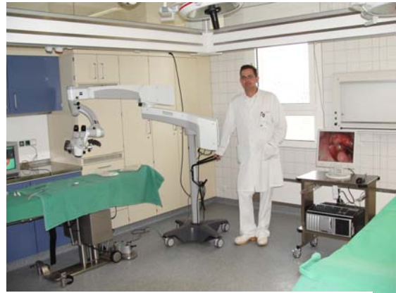
OP-Saal der HNO