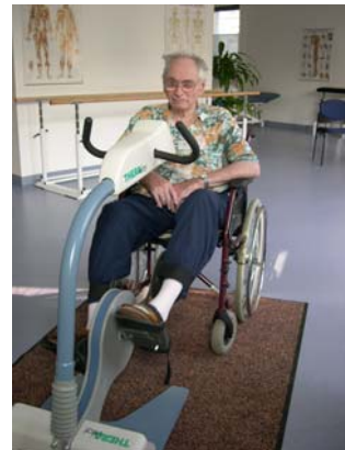
Abteilung Physikalische Therapie