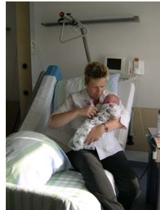
Integrative Wochenbettpflege mit Rooming-in