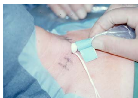
Ultraschallunterstützte Operation an der Schilddrüse