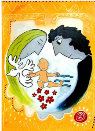
Logo der Abt. Geburtshilfe