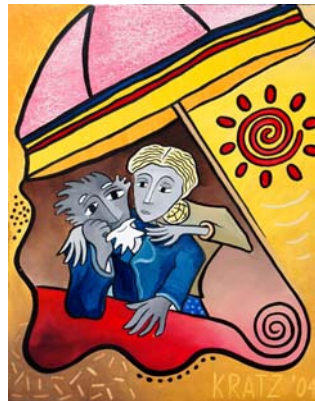
Logo der Abt. Innere Medizin/Geriatrie