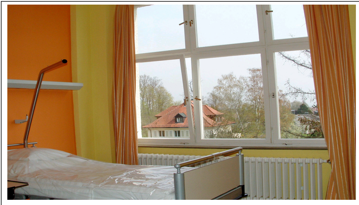
Patientenzimmer mit Blick auf den Wald

Die Vulpius Klinik erbringt keine Leistungen im Rahmen der Mindestmengenvereinbarung.