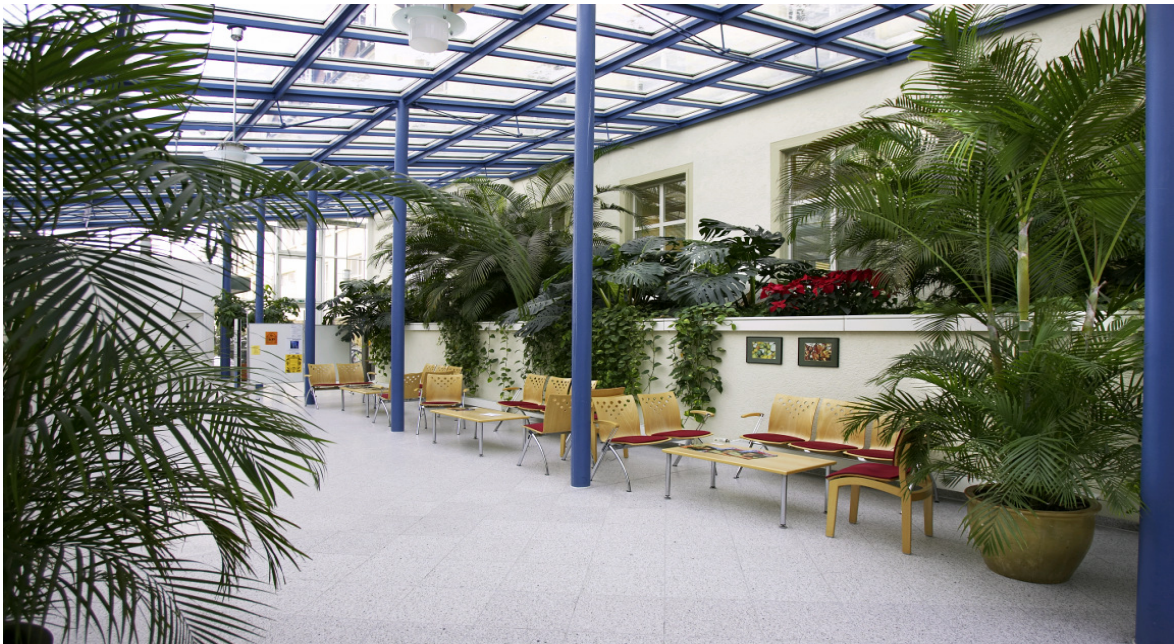
Der Eingangsbereich der Klinik mit Wartezone und Bistro