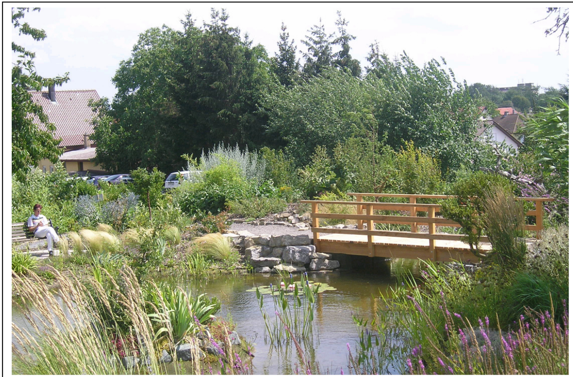
Der Gartenbereich der Klinik – eine Oase für unsere Patienten