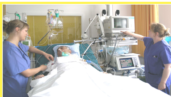
Krankenversorgung auf der Intensivstation