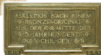
Historische Darstellung des Asklepios mit dem von einer Schlange umwundenen Stab, der zum Symbol der Heilkunst wurde.

Dieser Stab, umgeben von einem Kreis und einem Dreieck, bildet heute das Logo der Asklepios Gruppe.